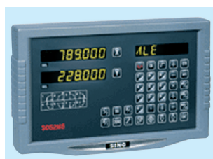
Visualizzatore di quote a tre assi di serie